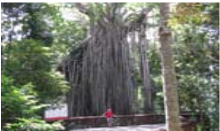
Fig curtain tree