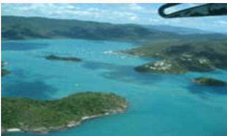
Korallöar från luften