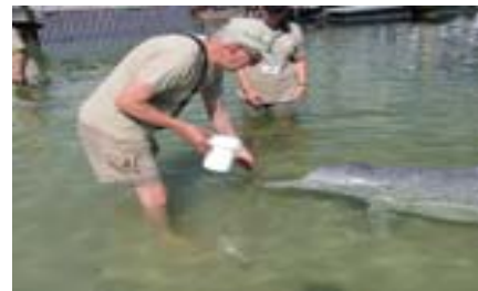
Matar delfiner Tin Can Bay