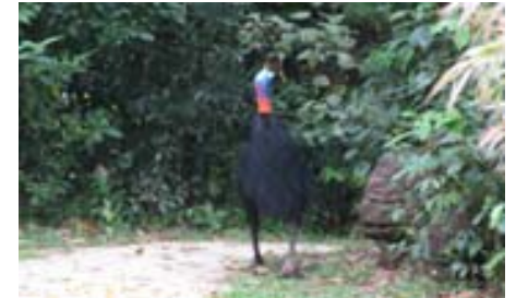
Cassowary smiter in i skogen