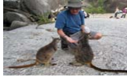
matar rock wallabies