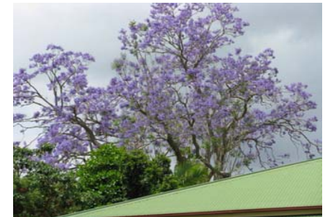
Jakarandan blommor överallt