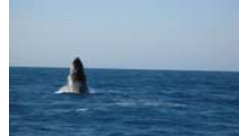
Grindval hoppar för oss