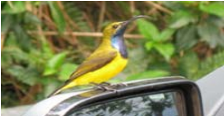
Yellowbellied sunbird på bilspegeln