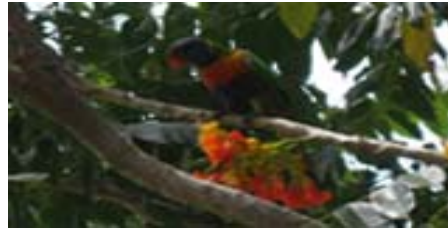
Rainbow Lorikeet i ett träd