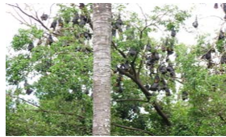
Flying foxes mitt in i Cairns