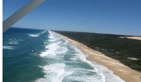
flyg över Fraser Island